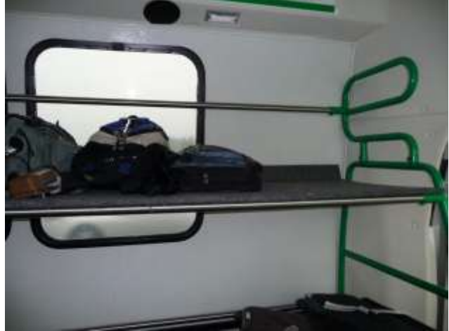
Compatimento para equipaje