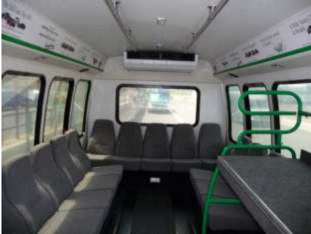
Interior shuttle bus