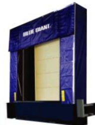
Serie 501 Abrigo de Andén Retractable

Fabricamos sellos especiales para diferentes declinaciones o inclinaciones.