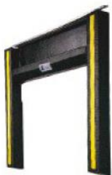
Serie 351 Para Alturas Especiales