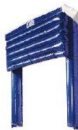
Serie 401 A Inflable Para Refrigeración