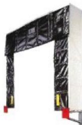
Serie 401 Shelter Mayor Durabilidad